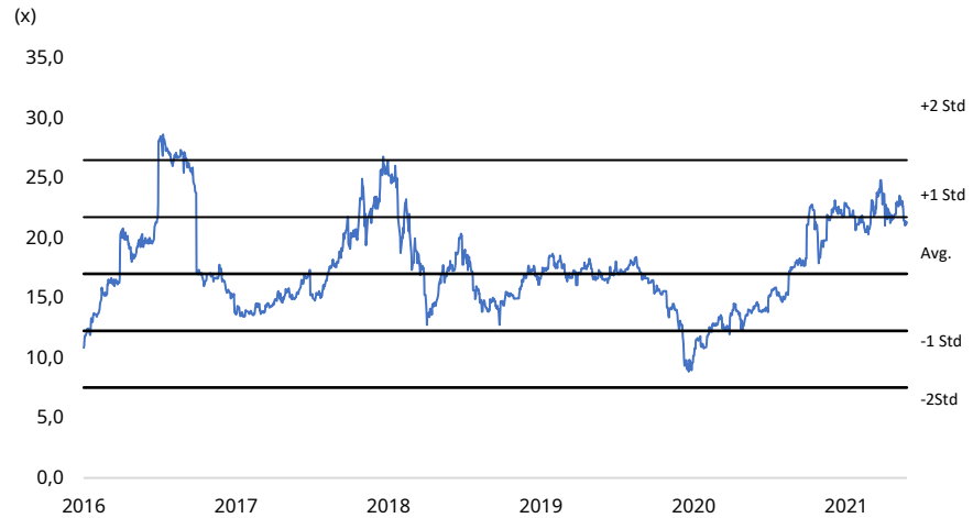
Hình 2: P/E 5 năm của GAS

Với mức dự báo LNST năm 2021 đạt 9.275 tỷ đồng, EPS của GAS đạt 4.846 đ/cp với mức P/E mục tiêu +1 Std tương ứng 21,16 lần. Kỳ vọng GAS có thể đạt mức giá 102.500 đ/cp.