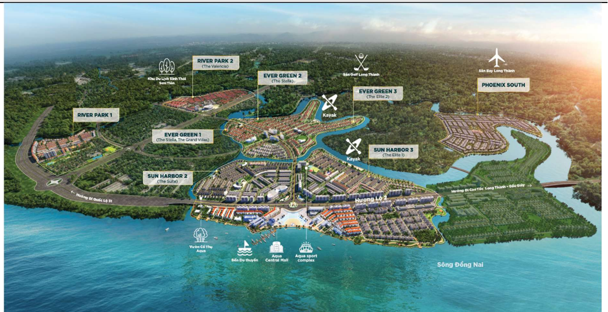
Hình 1. Bản đồ phối cảnh dự án Aqua City

Với khả năng bán hàng mạnh, chúng tôi ước tính NVL sẽ bàn giao khoảng 600 căn tại Aqua City trong năm 2021, thu về khoảng 6,100 tỷ đồng doanh thu.